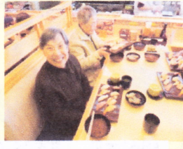
H28.3.25(金) 徳兵衛で寿司ランチ後、お雑様巡りの会場へ