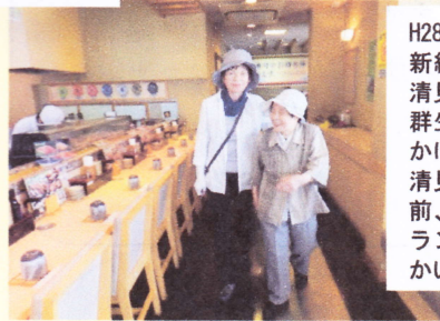
H28. 6. 8 (水) 新緑浴で皆で清見の水芭蕉群生地まで出かけました 清見へ向かう前、徳兵衛でランチして向かいました