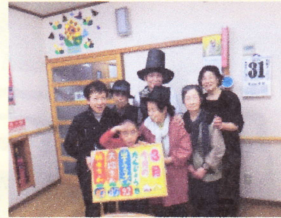
H28.3.31(木) 3月生まれの方のお誕生会 職員の子供も参加してくれました