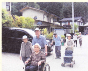
H28. 6. 22 (水) 今日は朝から爽やかな天気だったので、午前中から全員でお散歩にできました