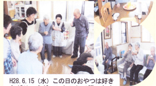
H28. 6. 15 (水) この日のおやつは好きなゼリーをジャンケンして勝った人から取って食べることにしました

H28. 6. 17(金) 三福寺の駿河屋エブリー店まで日用品のお買い物に出ました