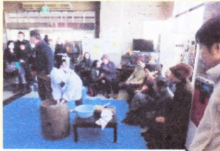
H28. 2. 18 (木)、福祉センター餅つき会に参加しました