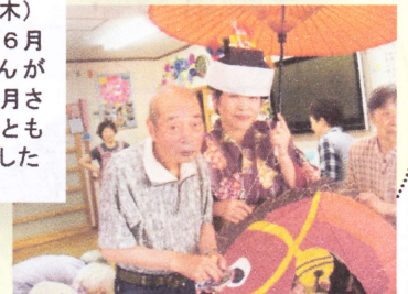
H28. 6. 23 (木) 陽だまりの6月の花嫁さんが「雨降りお月さん」の歌とともに登場しました