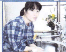
確りと、テキストを持ってみえて、やってくださいます